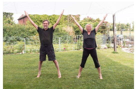
Juni 2020 im gerade fertiggestellten Garten am Hafen

Du suchst eine Wohnung, in der du auch im Alter gut und sicher wohnen kannst? Warte nicht ab, bis die ersten Zipperlein kommen, sondern werde jetzt aktiv!